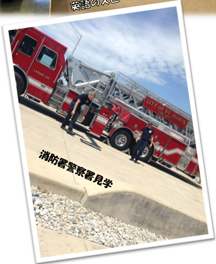
消防署警察署見学