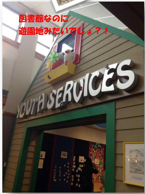
図書館なのに 遊園地みたいでしょ?!