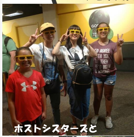
ホストシスターズと