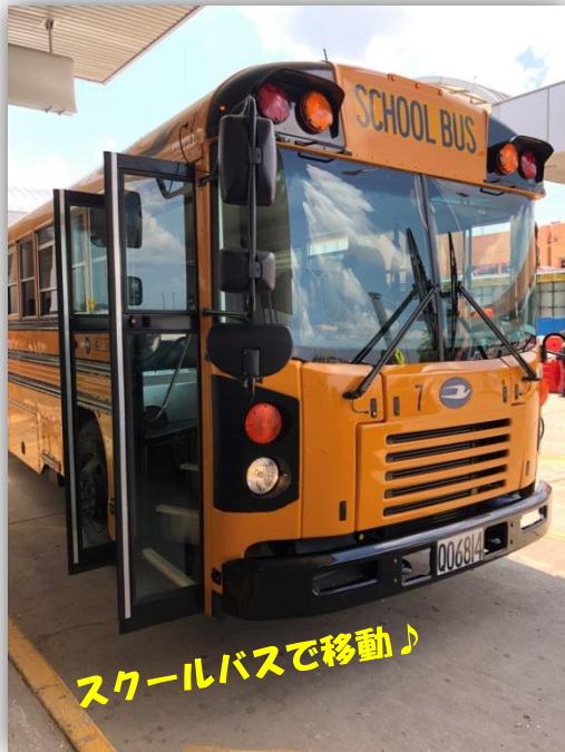
スクールバスで移動♪