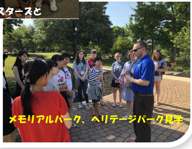
メモリアルパーク、ヘリテージパーク見学