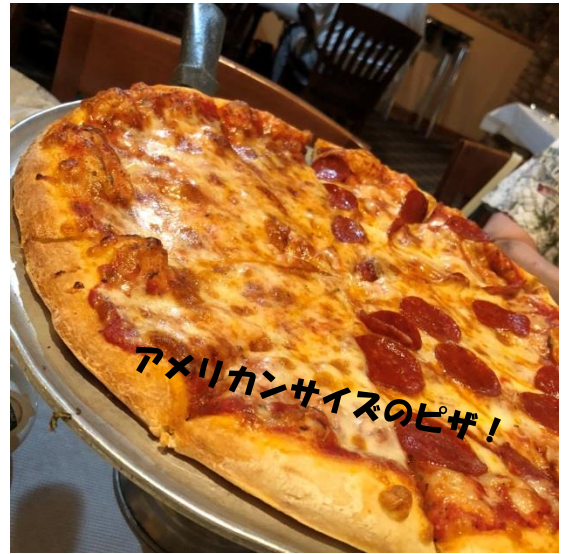
アメリカンサイズのピザ!