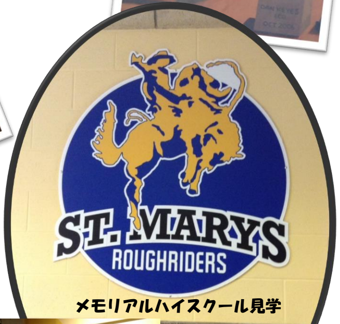
メモリアルハイスクール見学