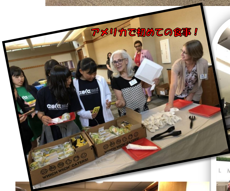
アメリカで初めての食事!