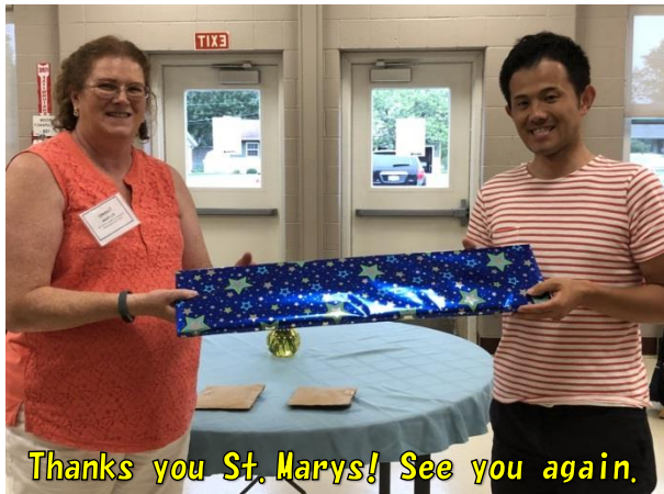
Thanks you St. Marys! See you again.