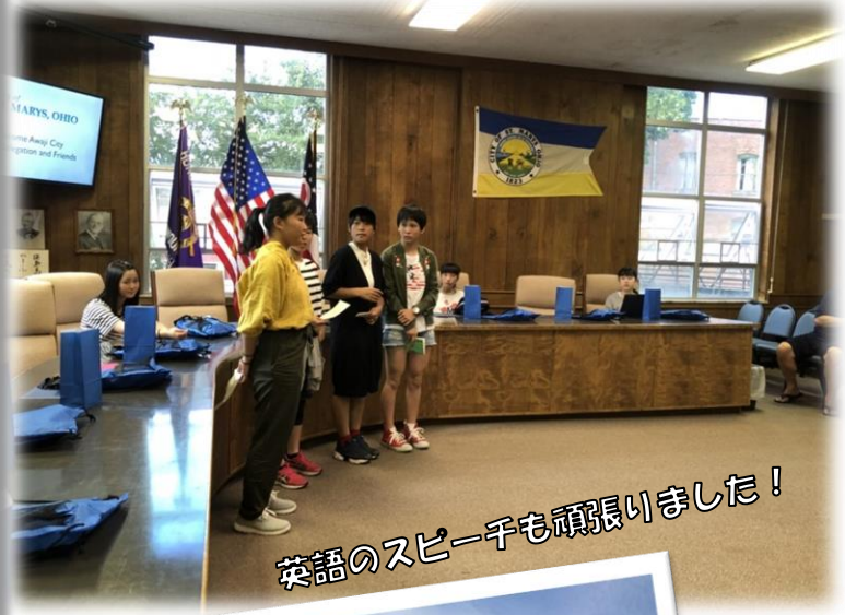
英語のスピーチも頑張りました!