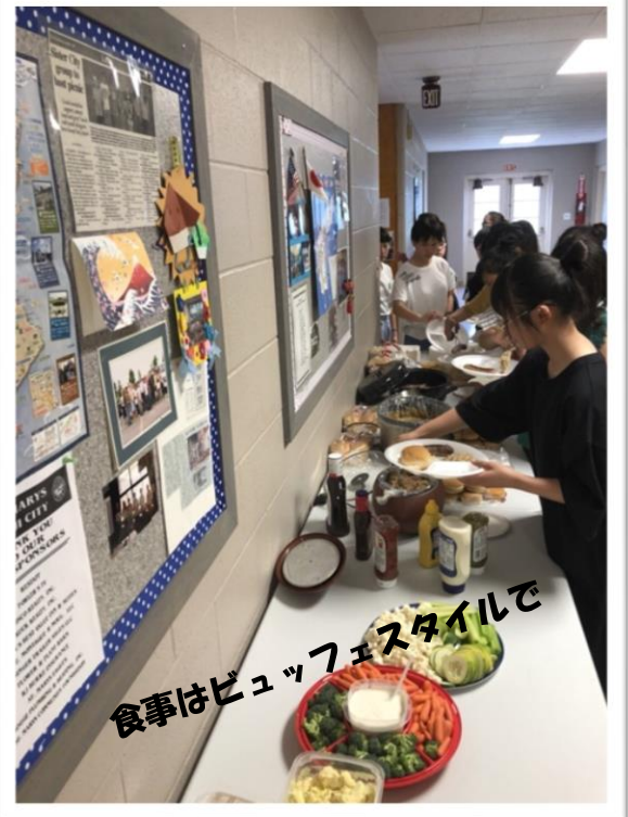
食事はビュッフェスタイルで