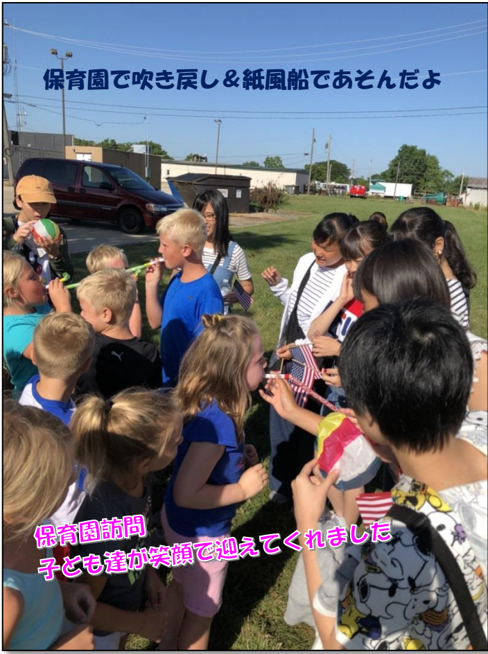
保育園で吹き戻し&紙風船であそんだよ