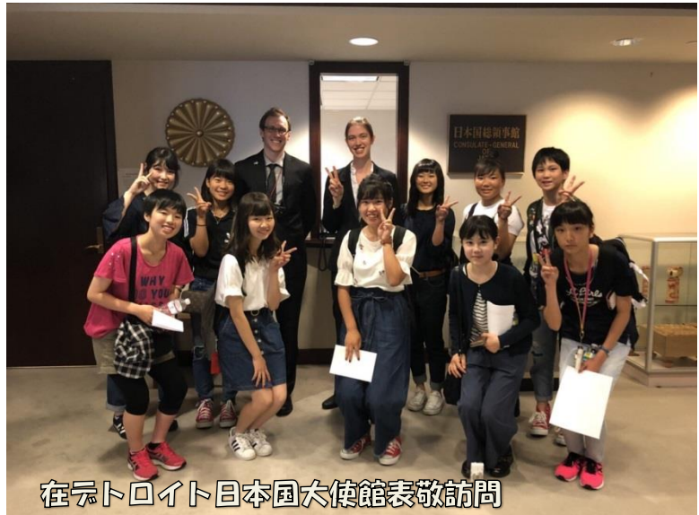
在シトロイト日本国大使館表敬訪問