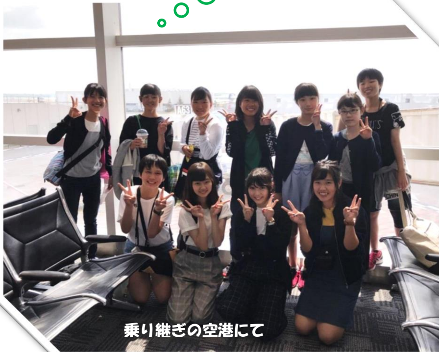
乗り継ぎの空港にて