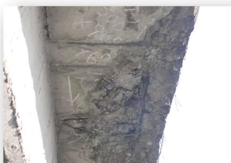
RC床版に剥離・鉄筋露出が見られます