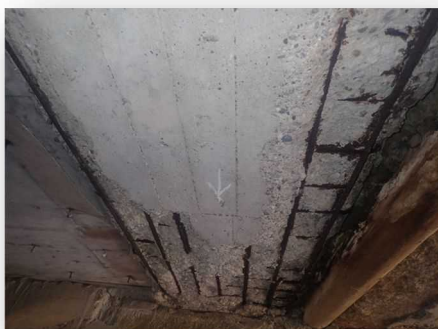
RC主桁に剥離・鉄筋露出が見られます