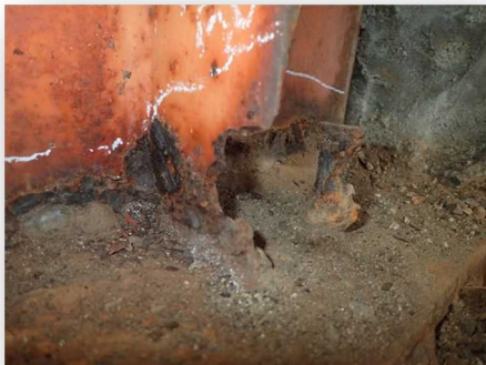
鋼橋の主桁に腐食が見られます