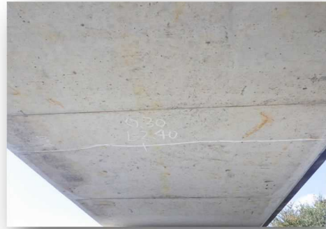
PC桁の主桁にひび割れが見られます