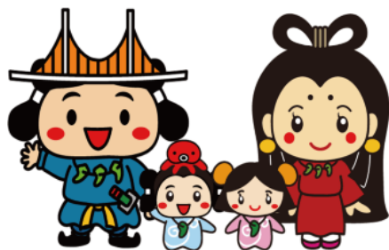
淡路市シンボルキャラクター「あわ神（あわじん）一家」