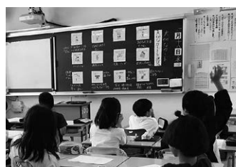
授業「大切なカード」