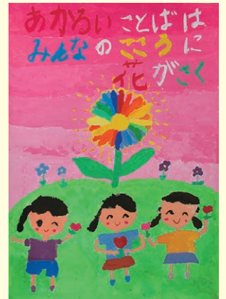
入選 南 春花 (一宮小2年)