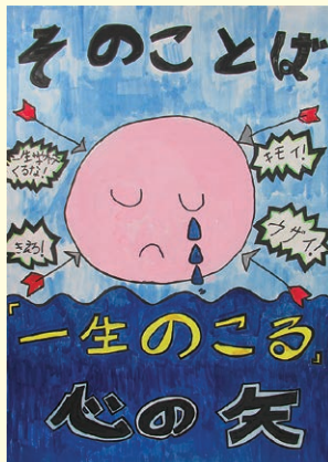
入選 樋口 はるか (石屋小2年)