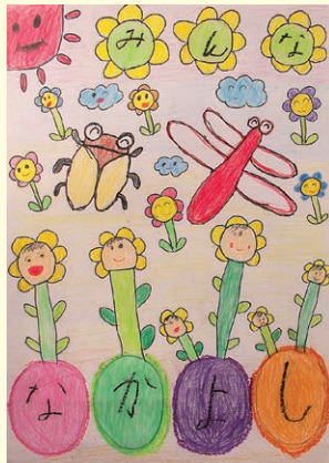
佳作 坂口 翔星 (浦小1年)