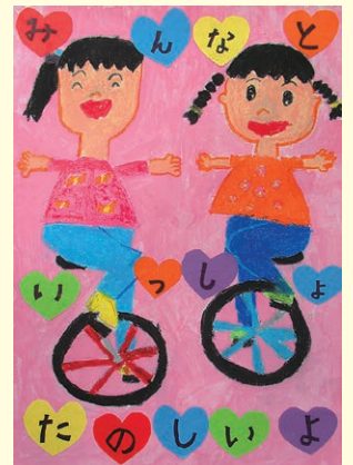
佳作 津田 葉菜 (志筑小2年)