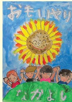
入選 今井 健太 (石屋小1年)