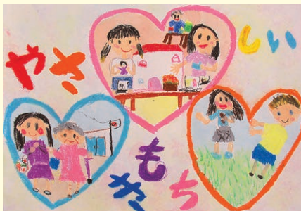
佳作 柏木 萌依 (一宮小1年)