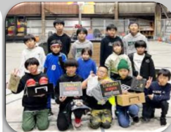
ストリートサッカー関西大会