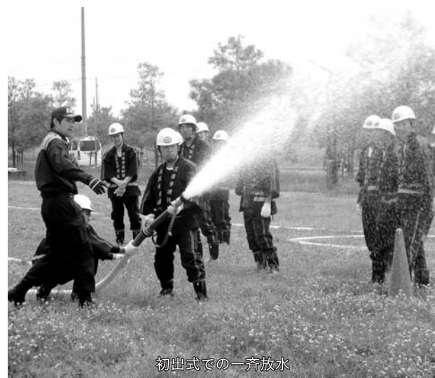
初出式での一斉放水