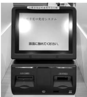
廃止が決まった窓口受付端末

答 令和3年4月1日から施行します。印鑑登録証明書の交付手数料は、コンビニ交付を利用した場合、「窓口受付端末機」利用と同様に、1件につき200円となっています。