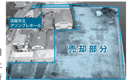
(株)パソナグループへ2億2,000万円で売却