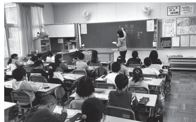
快適な学習環境を目指して

12月3日から19日まで17日間の会期で開きました。 下水道事業設置等の新規条例1件、行政組織条例等の改正 条例8件、財産処分等の事件決議8件を各常任委員会に付託 し、審査を行いました。 補正予算審査では、全ての市内小中学校の空調設備に必要 な設計費、7月豪雨により被災した農地、農業用施設、道路 等の災害復旧を含めた2会計を審査しました。 風しん予防接種助成、新火葬場周辺地域の地籍調査、有害 鳥獣対策などが計上されています。 一般質問には、13日から17日までの3日間で議員13人が登 壇し、市政全般にわたり質しました。