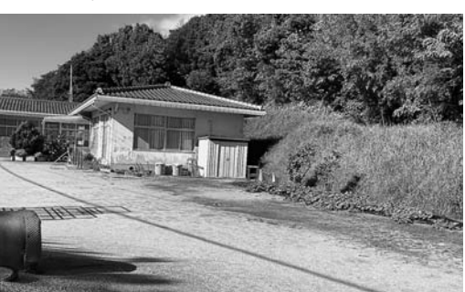
老朽化が著しい大町保育園