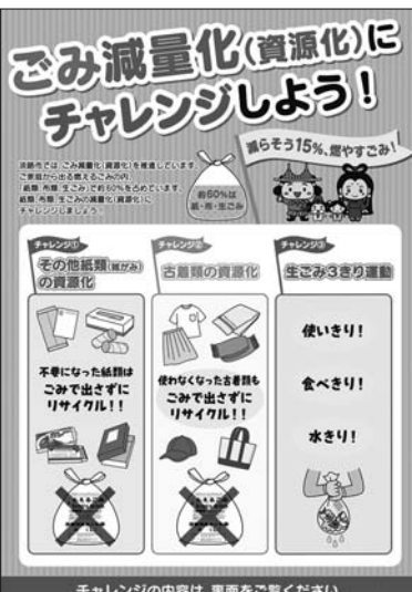
ごみ減量化を推進するチラシ

問 一人当たりの家庭から排出されるごみ量が県内市町で最も多く、最下位と市広報で周知された。ごみの減量化、資源化への対策を進めるべきでは。