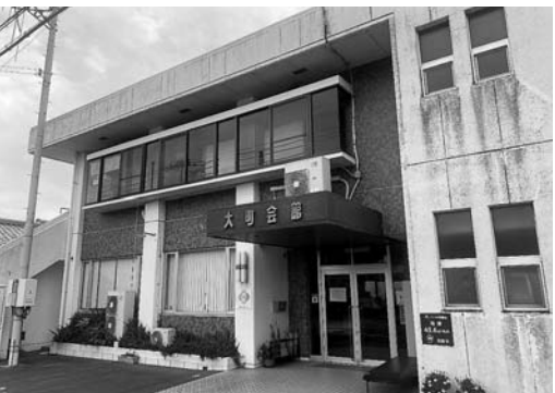
移転計画のある大町児童保育

問 午後6時までの受入れでは職種や勤務地が限られてしまう。受入時間の延長はできないのか。