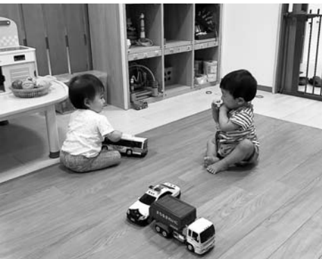
親子が憩える商業内施設