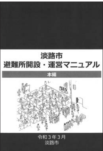
改訂変更された防災マニュアル