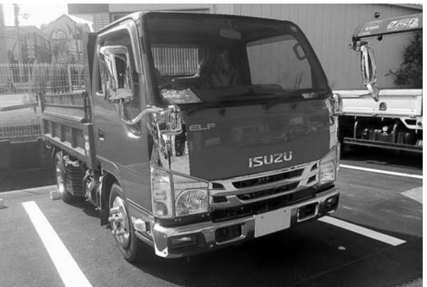
奉仕活動に向かう市民のトラック

問 市民の奉仕活動による道路補修に必要な原材料費が、年度後半になると予算を使い切り、材料支給ができない。毎年435万円余の予算を、来年度は2倍の900万円とし、要望の全てに込めるようにすべきだ。それにより、今の2倍の道路補修が可能となる。