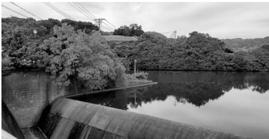
県の指定貯水施設である常盤ダム

問 地球温暖化の影響で、昨今ゲリラ豪雨や線状降水帯現象、900hPa級の猛烈台風等の発生も希ではない。日本一ため池が多い当市での豪雨水害対策以外に、ダム管理における下流域への影響や対策等を伺う。