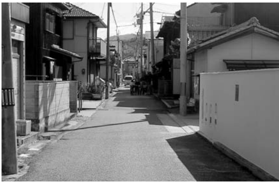
民泊施設のある育波浜地域

問 静かな住宅地の中に民泊施設がある地域で、一部の施設において利用者が夜中に大声を出して騒ぎ、庭でのバーベキューで煙や悪臭が充満するなど、トラブルが続く。周辺住民は我慢の限界だ。解決のための対応策は取っているのか。