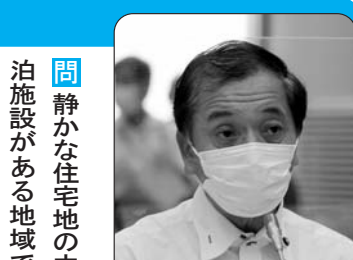
日本共産党 岡田 教夫

問 静かな住宅地の中に民泊施設がある地域で、一部の施設において利用者が夜中に大声を出して騒ぎ、庭でのバーベキューで煙や悪臭が充満するなど、トラブルが続く。周辺住民は我慢の限界だ。解決のための対応策は取っているのか。