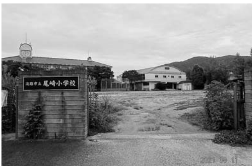
閉校後の尾崎小学校の様子

問 旧尾崎小学校を「食とアート」の中心施設と位置付け、活用計画されています。固定資産税の増収に加え、20〜30人の新規雇用が見込まれ、雇用の創出と定住化に貢献できるものと考えています。