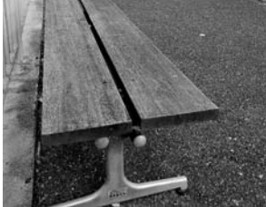
待ち時間の快適向上したバス停

問 昨今10月、市生活観光バスのルートや時刻などが改編された。しかし、課題も残り、住民から改善の要望もある。1年が経過するが、停車場や短区間料金減免など改善されるのか。