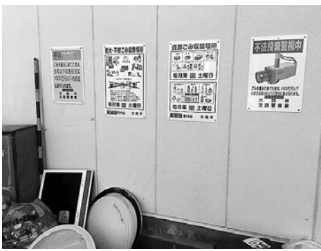
統一されつつある掲示ポスター