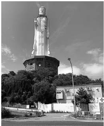
解体撤去が始まった大観音像

問 国は、大観音像の撤去後、地元自治体から取得要望を受け付けます。解体後の土地は、