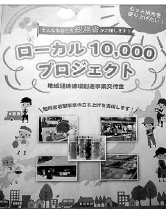
随時受付中の交付金事業の応募

問 国の「ローカル1000プロジェクト」は、地域の人材、資源、資金を活用し、新たなビジネスを立ち上げようとする事業者の初期費用を支援するものだ。この交付金を活用し、稼ぐ力と雇用力を高め、もっと地元を盛り上げ、地域が将来にわたって富を生み出す仕組みづくりにつながる支援への対応は、