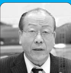
公明党 土井 晴夫