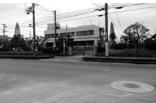
購入予定の企業庁の土地、建物