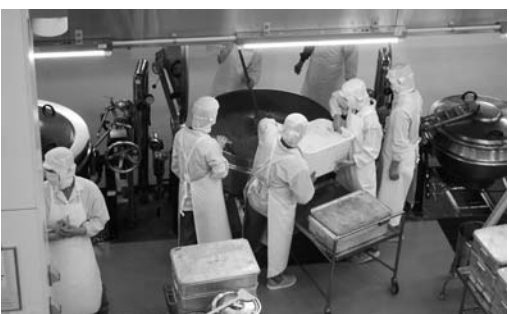
地産地消と健康育む給食センター

問 現状報告ではなく、具体策を聞きたい。県内他市では、金額補助や中学校を無償とする例もある。令和5年度に開始目途とする公費化は、滞納状況が数字で顕在化する。滞納が発生することは子どもの責任ではない