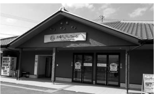
生田大坪だんだんファーム

問 地域づくりは、住民と共にやるという方向は同感だ。後はプラットホームの構築とサポートと思う。地域づくりサポーター（コンシェルジュ）の創設育成に一步踏み出し、地域の悩みに寄り添い、