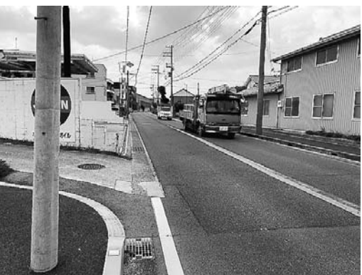
歩道整備が期待される中田地区

問 次のステップを総集と位置付け、5つの政策目標を掲げ、力強く進もうとされている。また、当初から各地区へのゾーン計画を立て、それぞれの均衡ある発展を目指し取り組み、ほぼ完成形に近づきつつある。来る2025年大阪万博に向け、本市の取組も今後重要であり、道路整備のうち県道中田地区の歩道整備を行うことにより、田園観光都市としての魅力がより増してくと考えるが、