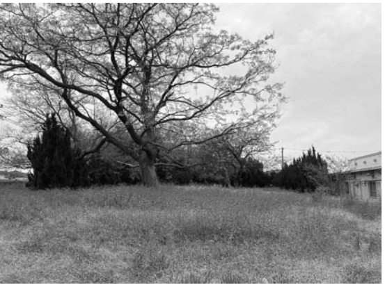
管理者に責任ある捨て墓

平成10年4月1日に、県から墓地等許可事務の移譲を受け、「淡路国津名郡墓地台帳」を引き継ぎました。市では実際の箇所数、現状確認は行っており、所有者等も把握していません。