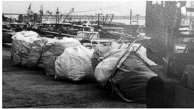
回収された膨大な海洋ごみの現状

県・市・漁協等において、漂流ごみ等の回収処理の在り方を検討し、地域の実情に応じた処理体制を構築することが必要と考えます。