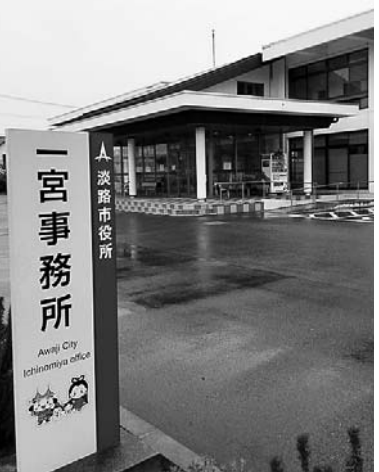
窓口機能となった地域事務所

問 合併後、約8200人減少の人口問題、窓口機能が中心となった各事務所とその周辺地域の疲弊。整備が急がれる各地域の市道、県内で2番目に高い水道料金、過去に約10億円で買い戻し、実態のない不明な不動産会社に転売し開発を委ねたこともあった夢舞台での企業誘致。 ● 最近になり、減少スピードが緩やかになった人口問題など至難の各事案については、各部署において着実に施策を実施しています。