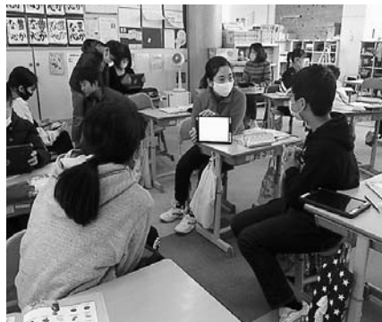
タブレットを使った授業の様子

● 押印廃止の具体的な取組は ● 学校トイレの洋式化への取組は ● 学校給食の公会計化への取組は