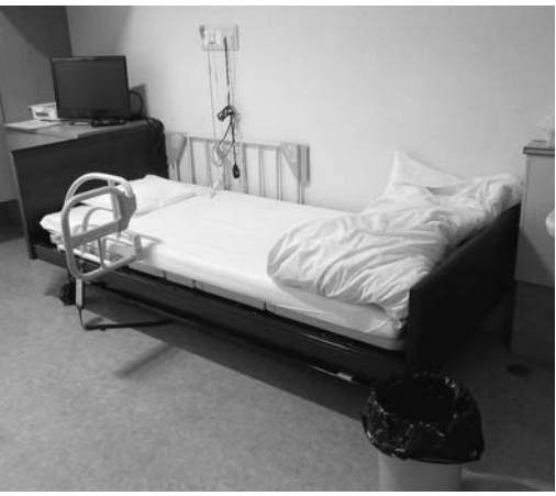
介護者の負担を軽減する介護用具

● 介護職員の雇用環境等確認のための実地指導を定期的に行っていきます。 ● 問入所者への虐待が多く報道されている。 ● 市内の施設では不適切な行為は発生してはいないか。