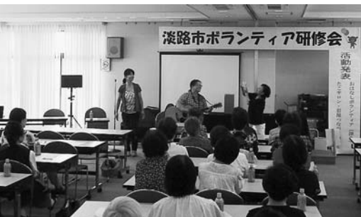
活発なボランティア養成の取組

都市機能集積ゾーンに位置付けている津名地域内に、地域福祉活動やボランティア活動の拠点となる施設を確保するため、旧シルバー人材センター敷地での建設を検討しました。しかし、新型コロナウイルス感染症の世界的規模での感染拡大により生活様式が一変し、新たな生活様式によるソーシャルディスタ