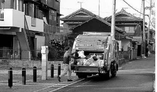
市民生活に不可欠なごみ収集事業

問 ごみ収集車から流れてくる「赤とんぼ」の曲(東浦地域は「エリーゼのために」)自体は素晴らしいが、朝から夕焼けのイメージに違和感の声もある。今日も一日頑張ろうという気持ちにさせる曲、さらに市民に親しみを持ってもらうためにも、市の独自曲「輝く淡路市」の使用が最適だと思いが。