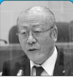
公明党 土井 晴夫

問 児童虐待は、コロナ禍も要因となり、全国的に急増している。市内の児童虐待の現状は。