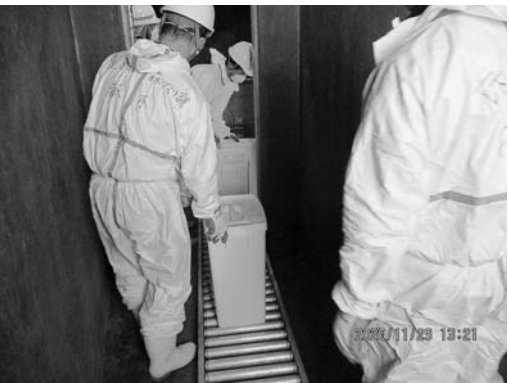
鳥インフルエンザの患者処分作業

淡路家畜市場での販売額は、合併時と現在を比べると大幅に増額している一方、販売頭数と畜産農家戸数は減少しています。引き続き畜産振興に向けた取組を進めます。