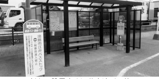
新たに設置する江井高速バス停