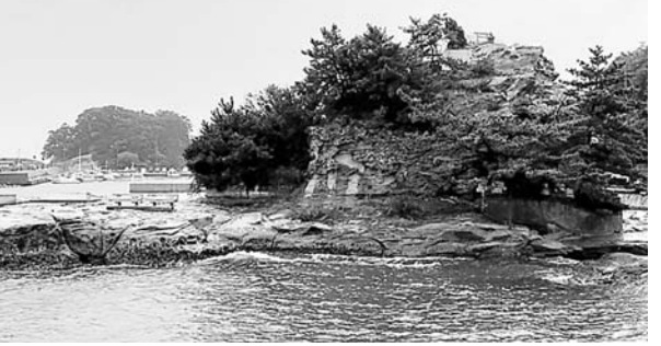
幼少期を過ごした岩屋の風景