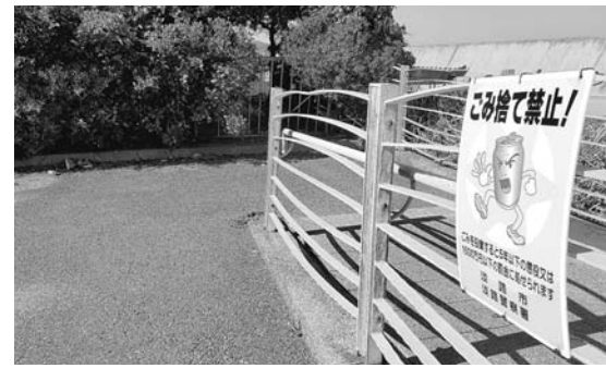
看板があっても捨てられるごみ