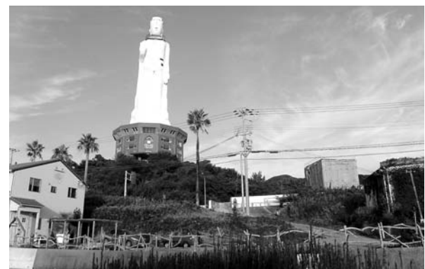
解体撤去が進む観音像周辺施設