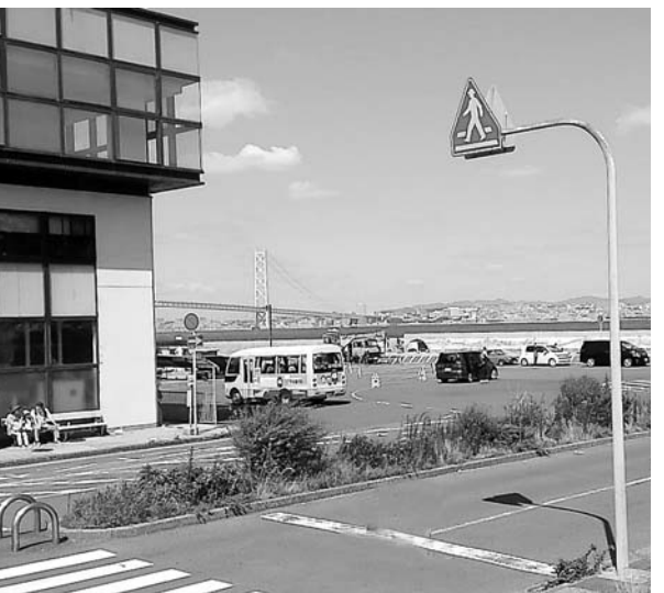
説明が必要な新ポートビル計画