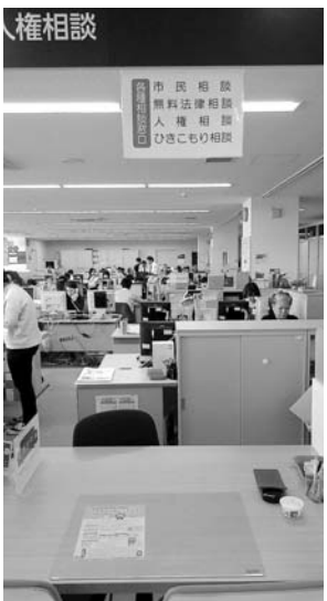
ひきこもり相談窓口 2号館1階