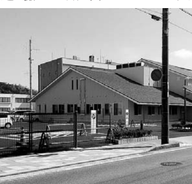
完成した津名ふれあいセンター