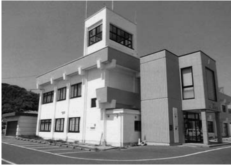
現地解決に努める地域事務所

地域の多岐にわたる課題等に対し、地域まちづくり協議会との協働、本庁窓口との細やかな情報を共有し、さらに市民に身近