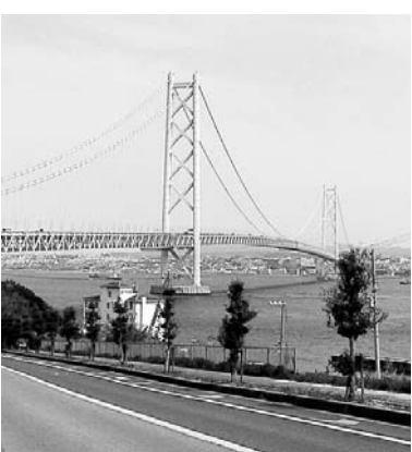
大橋を活用した施策も必要

【問】合併時の平成17年、約5万1000人の人口が、今年4万3000人と大きく減少している。国内においても少子高齢化であるが、特に本市は顕著であり、厳しい人口減少の現実がある。それにより様々な影響が出ており、今後、労働力減少により経済にも影響を与え、税収の減少も予想される事態となりかねない。