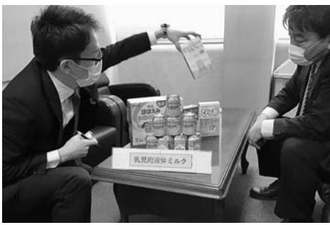
導入決定した乳児用液体ミルク

【答】乳児用液体ミルクを備蓄します 本年、缶タイプを24本と紙パックタイプを12本購入します。状況を見ながら、今後の保有数を調整