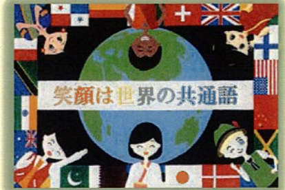
つじ かなな 辻 葉奈 (岩屋中学校 3年)