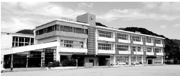
今後に期待する佐野小の跡地利用

社会減に一定の歯止めが掛かっている一方で、若年層の人口流出が大きな課題です。今後も「雇用」、「転入、転出」、「結婚、出産、子育て」、「地