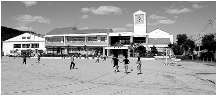
統廃合計画対象の小学校

現実的に困難な地域もありますが、計画を進めていきたいと考えています。北淡地域は、平成30年度の青波小と北淡小は予定どおりです。東浦地域は、平成31年度の金口小と学