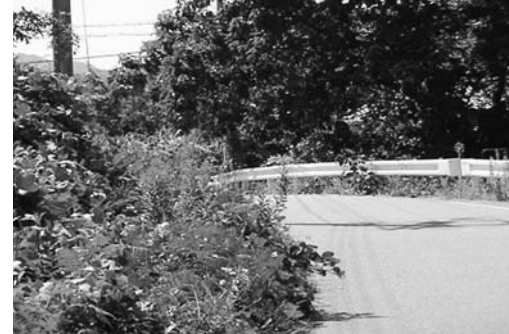
要望苦情が多く出ている雑草除去

利用件数と内容は、9月1日現在で相談数は263件、内容は道路の補修や雑草の除去、カープミラーの設置、河川や側溝の改修や清掃が主なものです。進行管理は要望ごとに関係部局と情報共有をし、1か月以内