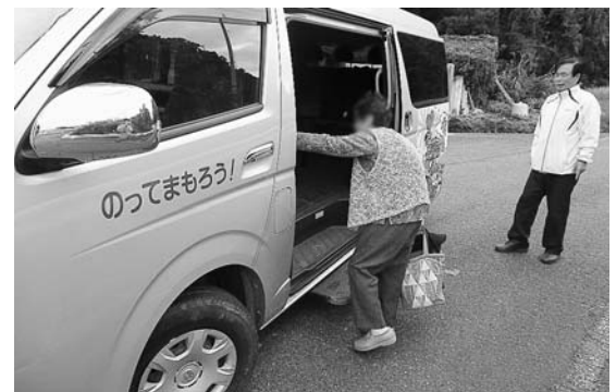
多くの市民が望む生活バス

立淡路医療センターへも含め検討中ですが、平成31年10月1日の運行開始を目指しています。